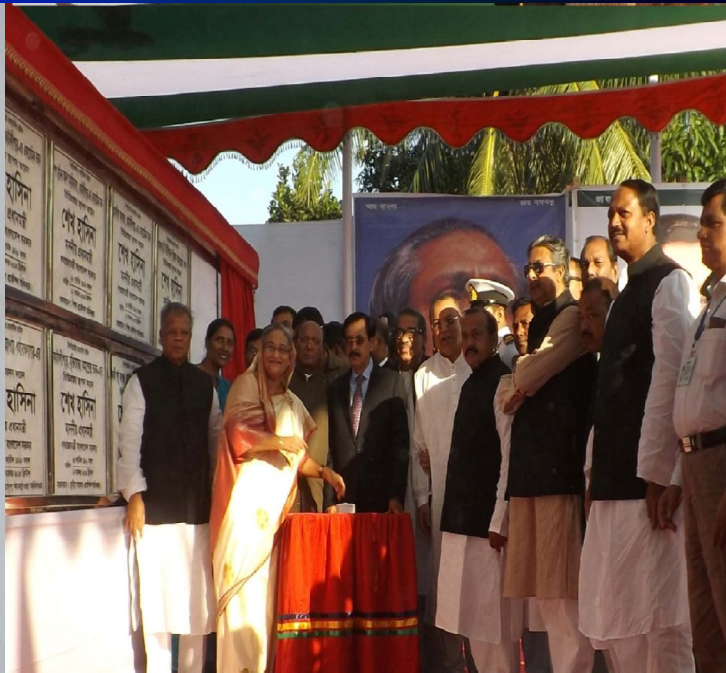
মাননীয় প্রধানমন্ত্রী কর্তৃক জেলা মুক্তিযোদ্ধা কমপ্লেক্স ভবন উদ্বোধন

বিস্মিল্লাহির রাহমানির রাহিম গোপালগঞ্জ মুক্তিযোদ্ধা কমপ্লেক্স ভবন শুভ উদ্বোধন করেন শেখ হাসিনা মাননীয় প্রধানমন্ত্রী গণপ্রজাতন্ত্রী বাংলাদেশ সরকার তারিখঃ ২৮ কার্তিক ১৪২০ বঙ্গাব্দ ১২ নভেম্বর ২০১৩ খ্রিস্টাব্দ বাস্তবায়নে : মুক্তিযুদ্ধ বিষয়ক মন্ত্রণালয়